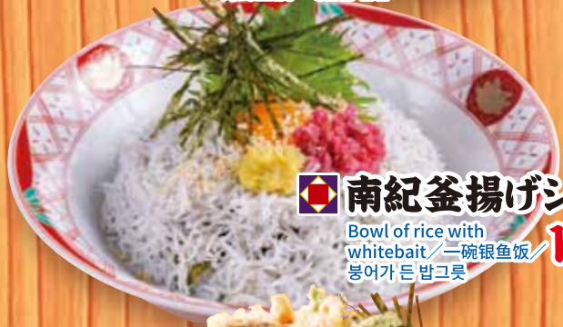
南紀釜揚げシラス丼 1,580円 Bowl of rice with whitebait / 一碗银鱼饭 / 붕어가든 밥그릇 (税込1,738円)