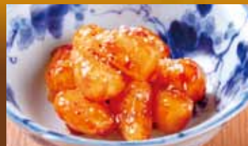
キムチらっきょう 320円 (税込352円) Rakkyo kimchi / 乐京泡菜 / 락교 김치