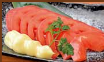
トマトスライス 320円 (税込352円) Sliced tomato / 番茄切片 / 알게 썬 토마토