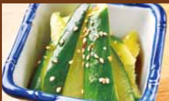
塩たれ胡瓜 320円 (税込352円) Seasoned cucumber / 凉拌黄瓜 / 맛 내기 오이