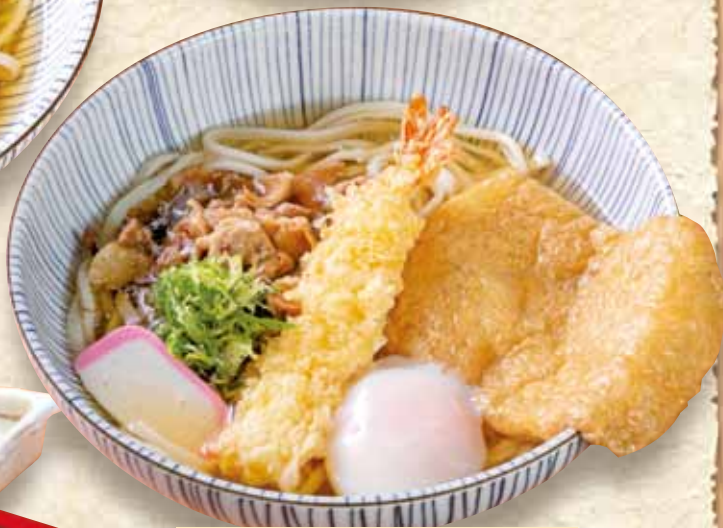
ホームランうどん 980円 Special Udon / (税込1,078円) 特色乌冬面 / 스페셜 우동