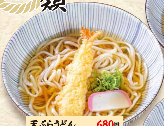
天ぷらうどん 680円 Udon with prawn Tempura / (税込748円) 虾天妇罗乌冬面 / 새우 튀김 우동