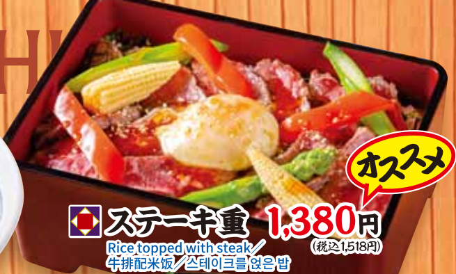
ステーキ重 1,380円 Rice topped with steak / 牛排配米饭 / 스테이크를 얹은 밥 (税込1,518円)