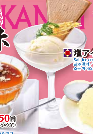
塩アイス 250円 Salt ice cream / 盐冰淇淋 / 소금 아이스크림 (税込275円)