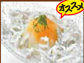
シラスおろし 350円 (税込385円) Whitebait grated radish / 物仔萝卜泥 / 시라스 오로시무