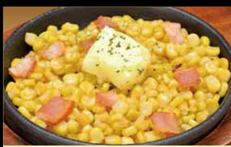
コーンバター 480円 Grilled corn with butter / (税込528円) 黄油烤玉米 / 옥수수버터구이