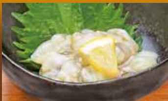
たこわさび 350円 (税込385円) Octopus Wasabi / 芥末章鱼 / 문어 와사비