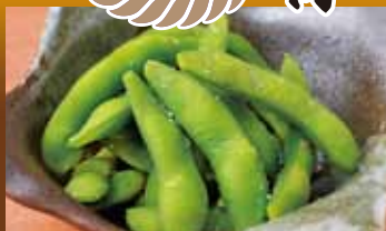
枝豆 300円 (税込330円) Soybeans / 毛豆 / 荚豆