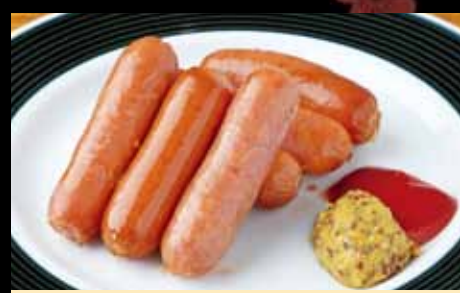
粗挽きソーセージ 480円 Pork sausage / (税込528円) 猪肉香肠 / 돼지고기 소시지