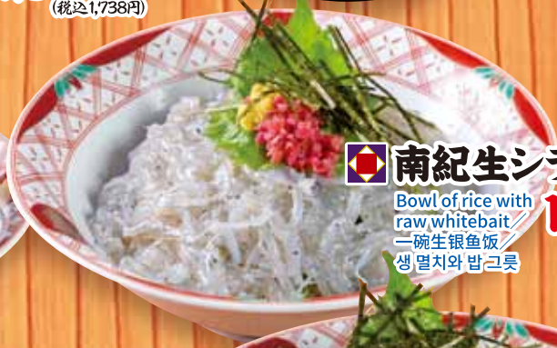
南紀生シラス丼 1,580円 Bowl of rice with raw whitebait / 一碗生银鱼饭 / 생 멸치와 밥그릇 (税込1,738円)