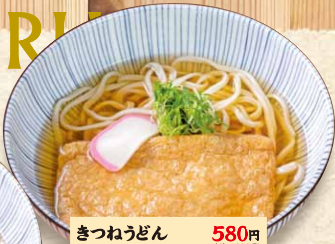
きつねうどん 580円 Udon with deep-fried tofu / (税込638円) 油炸豆腐乌冬面 / 기쓰네 우동