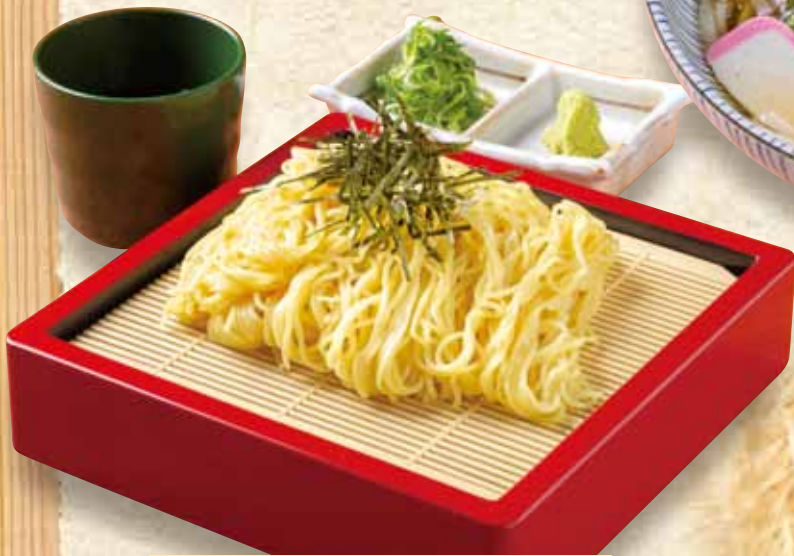
ざるラーメン 580円 Ramen noodles with dipping sauce / (税込638円) 蘸面 / 츠케멘