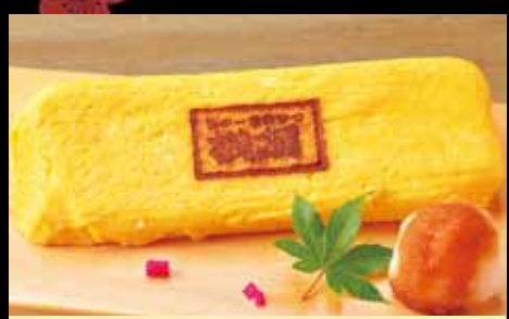
出し巻き玉子 480円 Japanese style rolled omelet / (税込528円) 日式鸡蛋卷 / 계란 구이