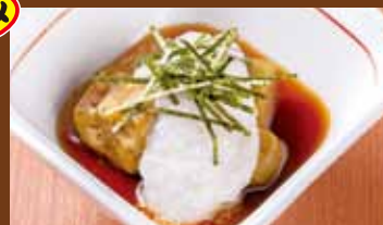
焼き茄子山かけ 350円 (税込385円) Grilled eggplant with yam / 山药烤茄子 / 야키노모코야마 고품마