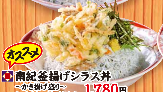
南紀釜揚げシラス丼 ~かき揚げ盛り~ 1,780円 Bowl of rice with whitebait on Tempura fritters / 一碗银鱼饭配天妇罗油条 / 튀김 튀김에 붕어를 곁들인 밥그릇 (税込1,958円)