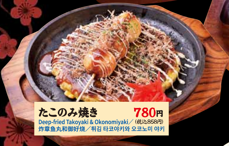
たこのみ焼き 780円 Deep-fried Takoyaki & Okonomiyaki / (税込858円) 炸章鱼丸和御好烧 / 튀김 타코야키와 오키노미 야키