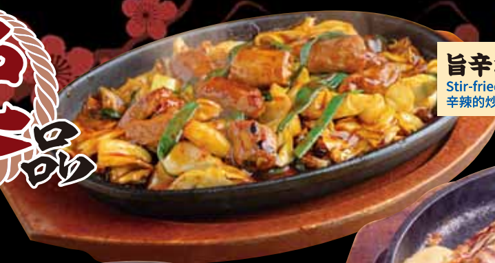
旨辛ホルモン焼き 650円 Stir-fried spicy beef variety meats / (税込715円) 辛辣の炒牛内臓 / 매운 볶음 소 내장 고기