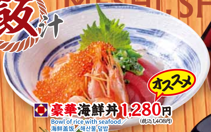
豪華海鮮丼 1,280円 Bowl of rice with seafood / 海鮮盖饭 / 해산물 덮밥 (税込1,408円)