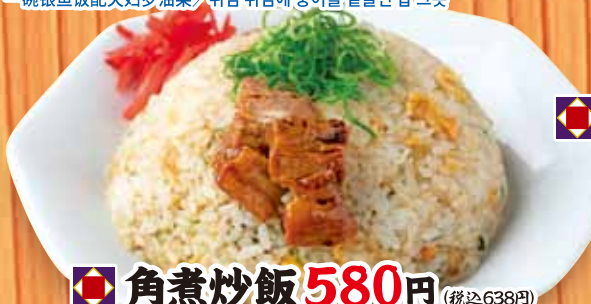
角煮炒飯 580円 Fried rice with Japanese braised pork belly / 日式红烧肉炒饭 / 일본식 돼지갈비찜 볶음밥 (税込638円)