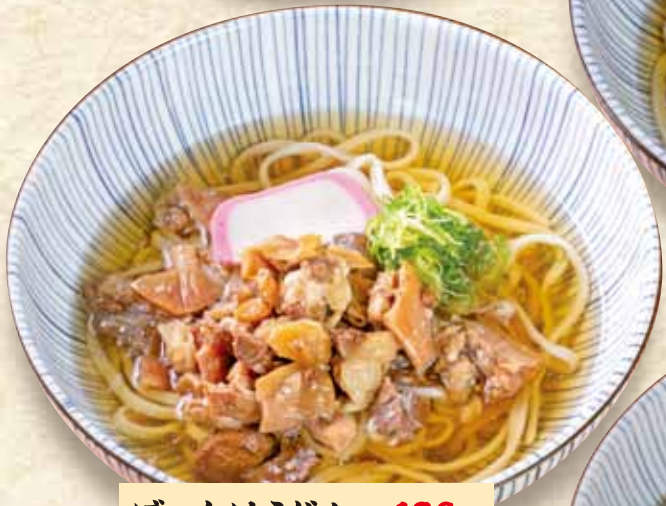
ぼっかけうどん 680円 Bokkake Udon / (税込748円) 苏志功烏冬面 / 북카케 우동