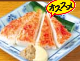
蟹蒲胡瓜 380円 (税込418円) Imitation crab cucumber / 仿蟹黄瓜 / 모조 게 후원