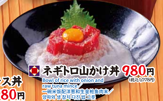
ネギトロ山かけ丼 980円 Bowl of rice with onion and raw tuna mince / 一碗米饭配洋葱和生金枪鱼肉末 / 양파와 생 참치 다진 밥그릇 (税込1,078円)