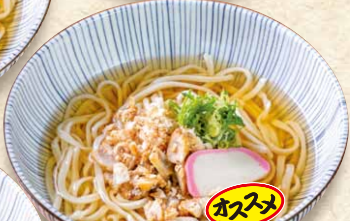
かすうどん 680円 Udon containing deep-fried beef offal / (税込748円) 大阪油粕烏冬面 / 카스우동