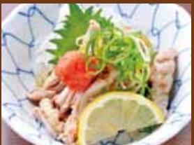
せせりポン酢 380円 (税込418円) Chicken neck meat with ponzu / 鸡脖子橙醋 / 닭 가슴살 편치