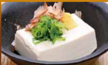
冷奴 300円 (税込330円) Cold tofu / 凉拌豆腐 / 냉 두부