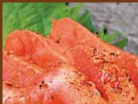
炙り明太子 550円 (税込605円) Roasted cod roe / 烤鳕鱼子 / 구운 명란젓