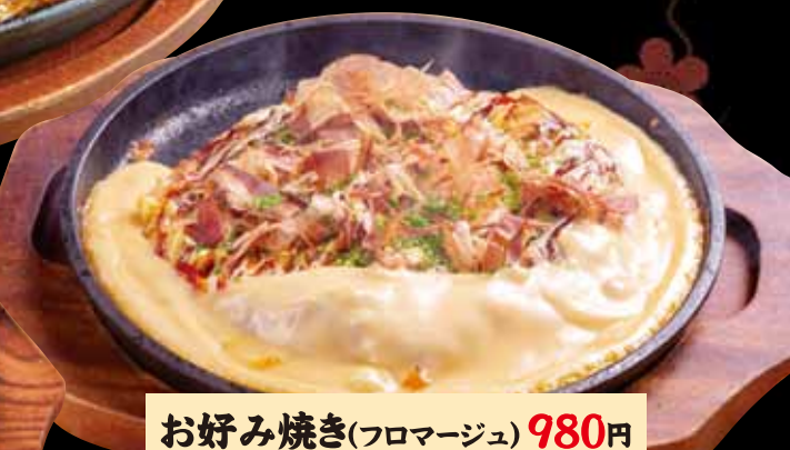
お好み焼き(フロマージュ) 980円 Okonomiyaki(fromage) / (税込1,078円) 奈样煎饼(芝士) / 오키노미야키(치즈)