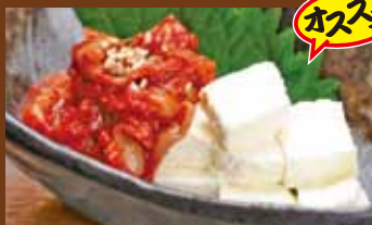
クリームチーズのチャンジャ添え 380円 (税込418円) Spicy cod Innards and cheese / 辣拌鳕鱼内脏和奶油奶酪 / 창랑젓 크림치즈