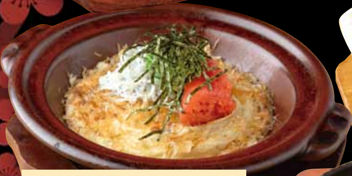
明太シラスとろろ焼き 780円 Japanese yam pancakes grilled dish (税込858円) with spicy cod roe whitebait / 日式山药煎饼明太子鮭仔鱼 / 감자 부침개 명란젓 빵어