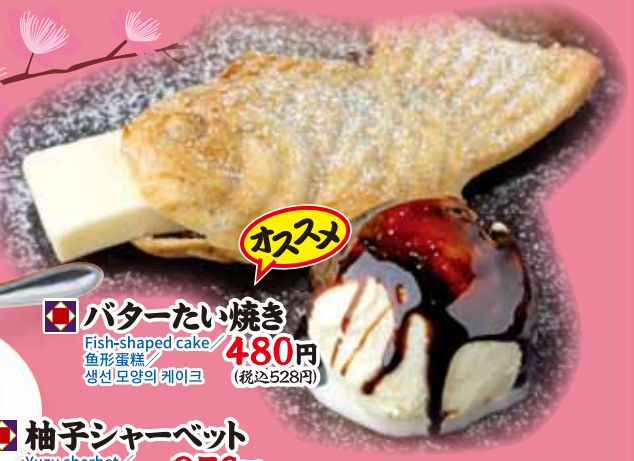
バターたい焼き 480円 Fish-shaped cake / 鱼形蛋糕 / 생선 모양의 케이크 (税込528円)