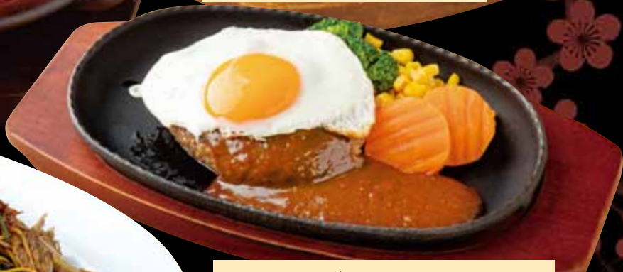
ハンバーグ 680円 ●選べるソース(デミグラス・おろしポン酢) (税込748円) Hamburger steak / 汉堡牛排 / 햄버그 스테이크