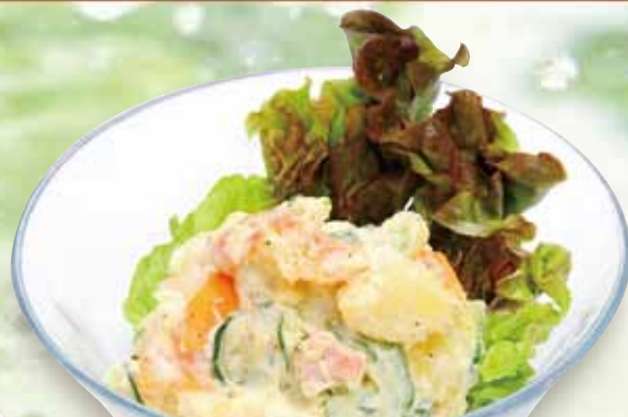
ポテトサラダ 380円 (税込418円) Potato salad / 马铃薯沙拉 / 감자 샐러드