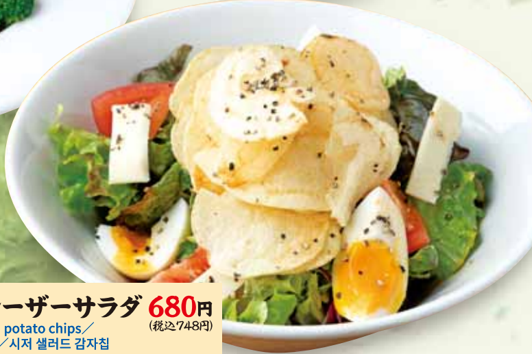
チップスシーザーサラダ 680円 (税込748円) Caesar salad with potato chips / 土豆片的凯撒沙拉 / 시저 샐러드 감자칩