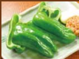
肉味噌ピーマン 350円 (税込385円) Meat miso peppers / 肉味噌辣椒 / 고기 된장 피망