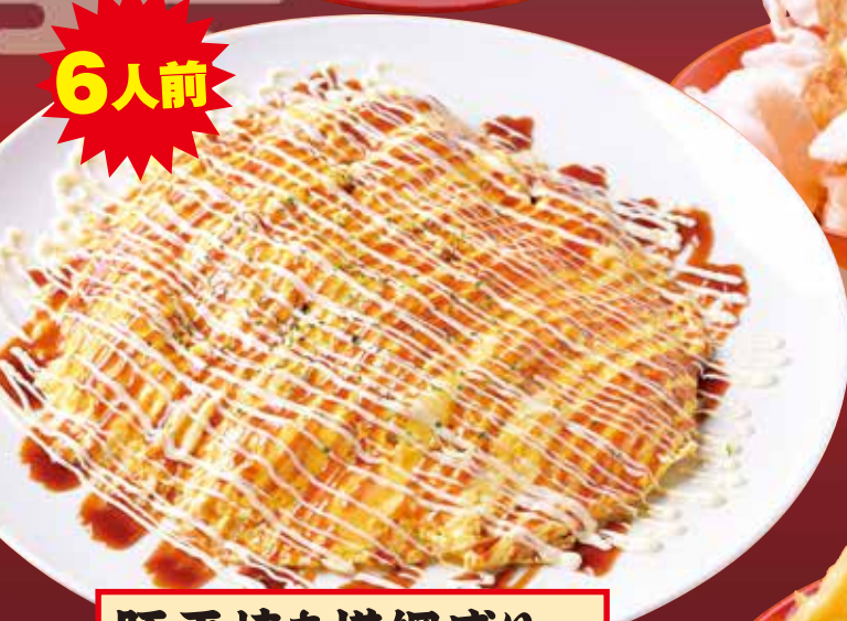
豚平焼き横綱盛り Omelette of pork / 煎蛋卷猪肉 / 돼지 고기 오믈렛 999円