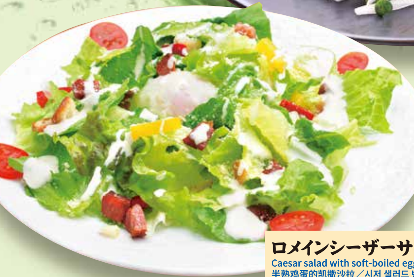
ロメインシーザーサラダ 580円 Caesar salad with soft-boiled egg / 半熟鸡蛋的凯撒沙拉 / 시저 샐러드 반숙 계란