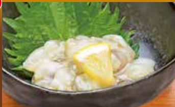
たこわさび 350円 Octopus wasabi / 芥末章魚 / 문어 와사비