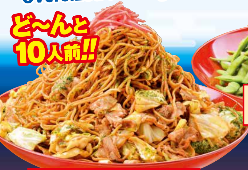
新世界焼きそば横綱盛り Fried noodles / 日式炒面 / 야키소바 1,120円