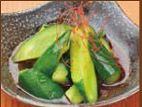
やみつき胡瓜 450円 Seasoned cucumber / 凉拌黄瓜 / 맛 내기 오이