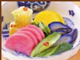
漬物盛り合わせ 420円 Assorted pickles / 咸菜拼盘 / 모듬 피클