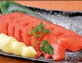
トマトスライス 420円 Camembert cheese with miso flavored / 带有味噌味番茄片泡芙 / 몽땅 반 토방 치즈 토마토