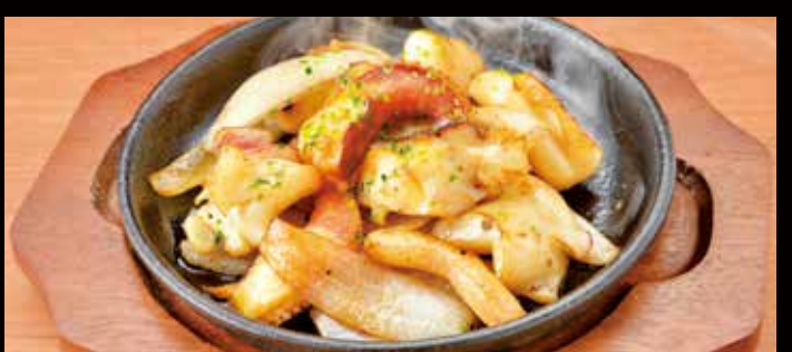
ゲソバター醤油焼き 480円 Squid legs fried in butter / 魷鱼腿黄油炒 / 버터에 튀긴 오징어 다리