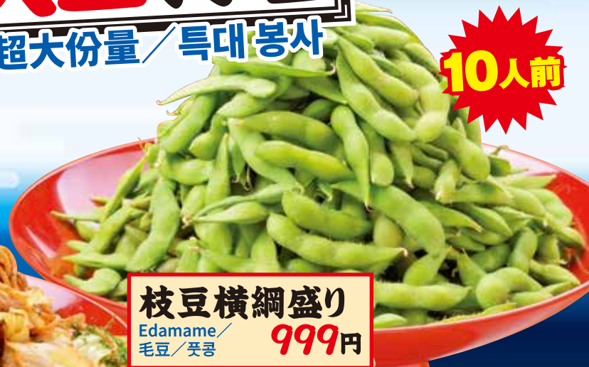
枝豆横綱盛り Edamame / 毛豆 / 풋콩 999円