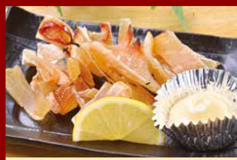
エイヒレ炙り 420円 Grilled stingray fin / 烤黄貂鱼翅 / 가오리 지느러미 구이