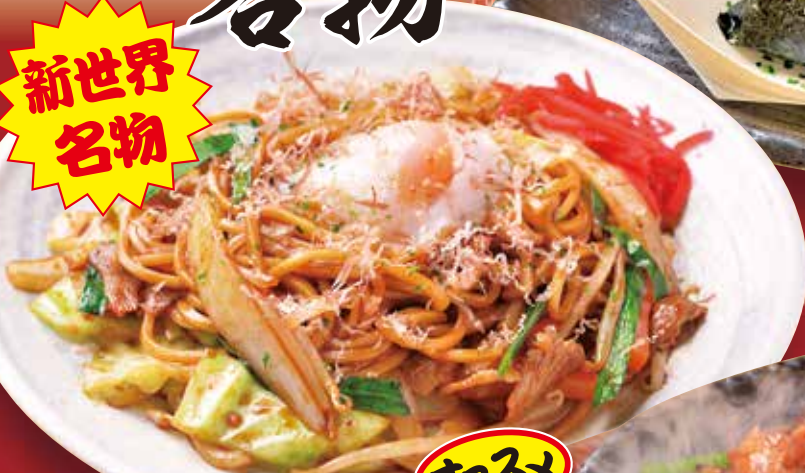
新世界焼きそば Fried noodles / 日式炒面 / 야키소바 550円