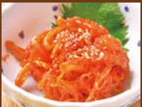
自家製するめいかキムチ 420円 Squid kimchi / 魷魚泡菜 / 오징어 김치