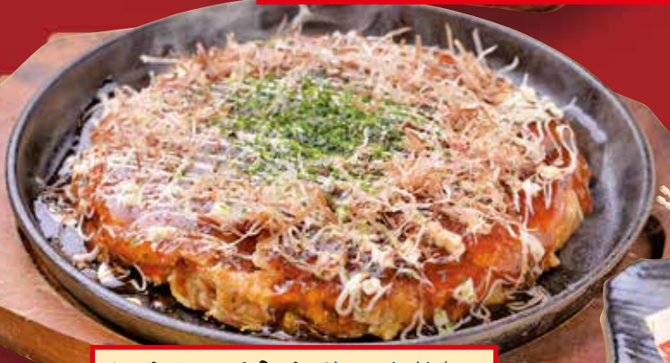
お好み焼き Okonomiyaki / 大阪烧 / 오코노미야키 ・豚玉 680円 Pork & egg / 猪肉, 鸡蛋 / 돼지고기, 계란 ・いか玉 680円 Squid & egg / 乌贼 鸡蛋 / 오징어, 계란 ・ミックス玉 750円 Pork, squid, shrimps & egg / 猪肉, 乌贼, 虾, 鸡蛋 / 돼지 고기, 오징어, 새우, 계란