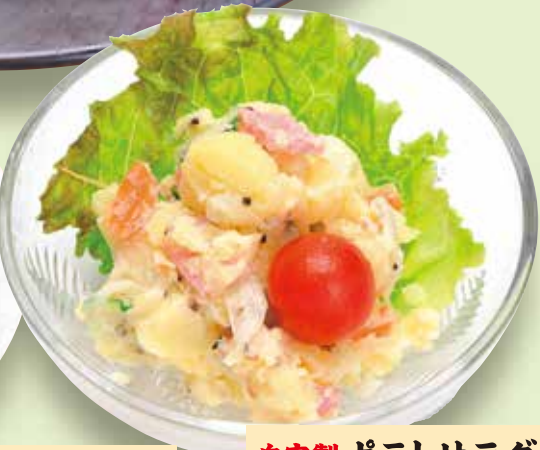
自家製ポテトサラダ 380円 Potato salad / 土豆沙拉 / 감자 샐러드