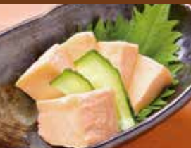
カマンベールチーズ味噌漬け 420円 Camembert cheese with miso flavored / 带有味噌味番茄片泡芙 / 몽땅 반 토방 치즈 토마토