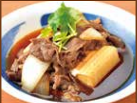
肉豆腐 420円 Simmered meat and Tofu / 豆腐煮肉 / 조림과 두부 조림