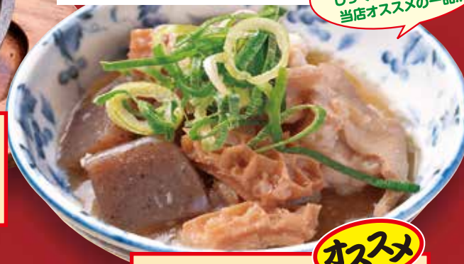
もつ煮込み Beef innards stew / 牛杂炖煮 / 내장 조림 420円