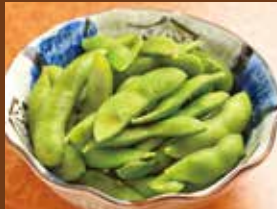
枝豆 420円 Edamame / 毛豆 / 풋콩