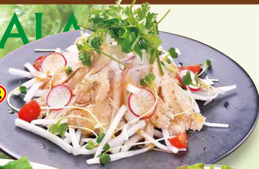
ハーブチキン 香味大根サラダ 580円 Chicken and radish salad / 鸡和萝卜沙拉 / 닭고기와 무 샐러드