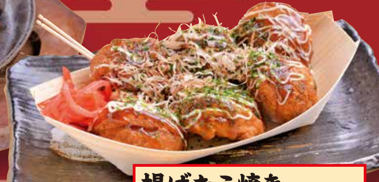
揚げたこ焼き Deep-fried Takoyaki / 炸章鱼小丸子 / 튀김 타코야끼 350円