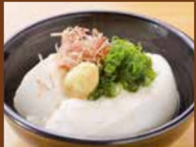
冷奴 420円 Cold tofu / 凉豆腐 / 냉 두부