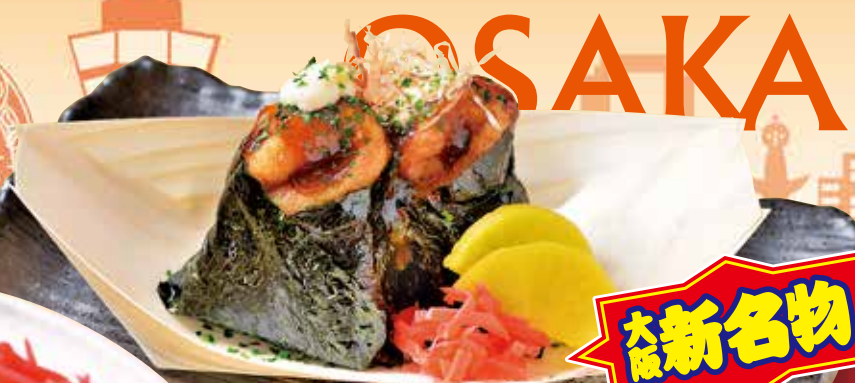
たこむす 350円 Takoyaki in rice balls / 章鱼烧在饭团 / 타코 야키 주먹밥