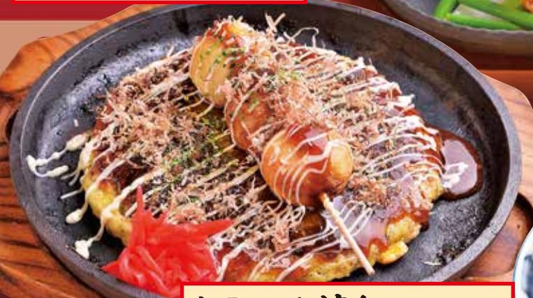
たこのみ焼き Deep-fried Takoyaki & Okonomiyaki / 炸章鱼丸和御好烧 / 튀김 타코야키와 오코노미 야키 780円