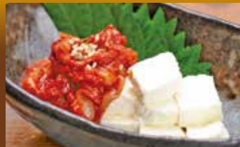
クリームチーズのチャンジャ添え 380円 Cod's bowls with kimchi and cream cheese / 腌辣鱈魚和奶油奶酪 / 창란젓 립치즈