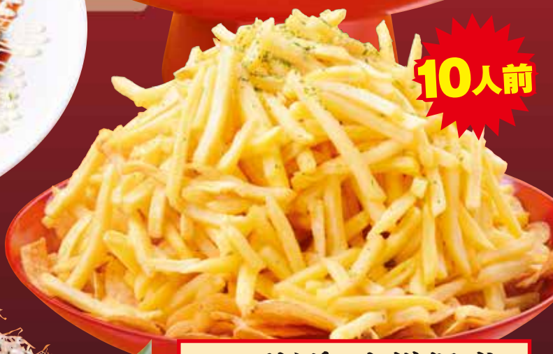
フライドポテト横綱盛り French fries / 炸薯条 / 감자 튀김 999円