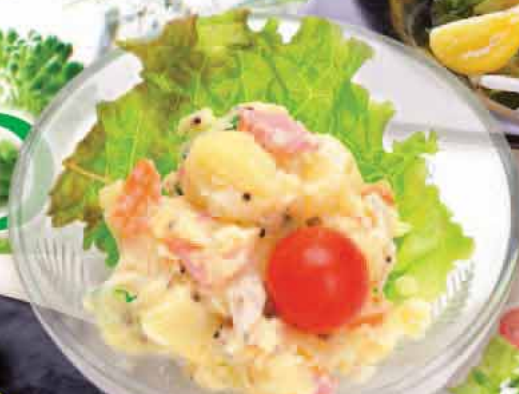
ポテトサラダ 380円 Potato salad 土豆沙拉 감자 샐러드