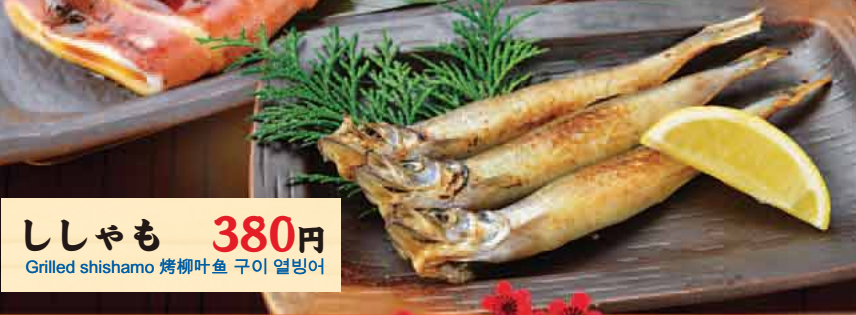
ししやも 380円 Grilled shishamo 烤柳叶鱼 구이 열빙어