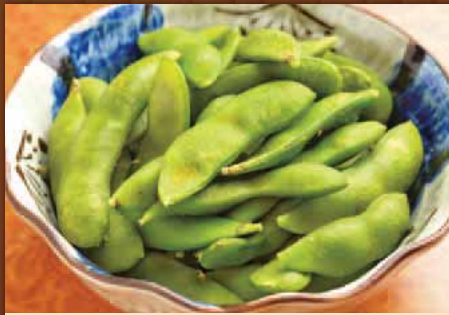
枝豆 Edamame 毛豆 에다마메