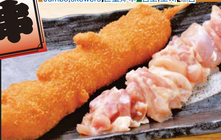
◆ 大山地鶏串かつ Daisen brand chicken 炸大山地雞肉串 대산토종닭 一本 450円