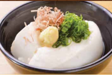
手作り豆腐 Cold tofu 凉豆腐 냉 두부