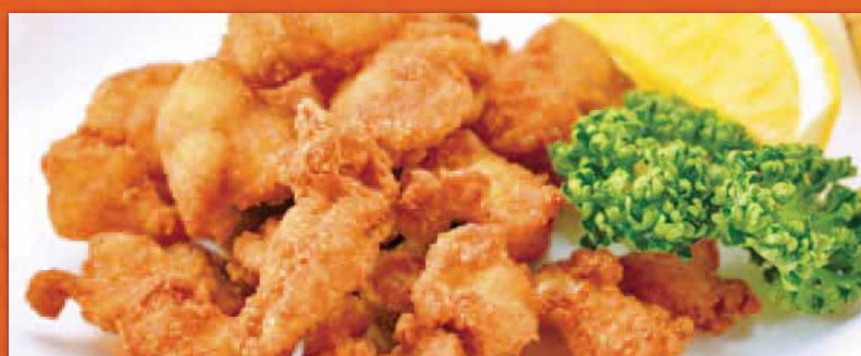
軟骨唐揚げ 400円 Deep-fried cartilage 炸鸡软骨 연골 튀김