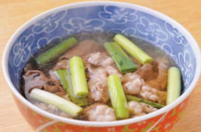
肉吸い Meat soup 肉吸汤 고기 나고