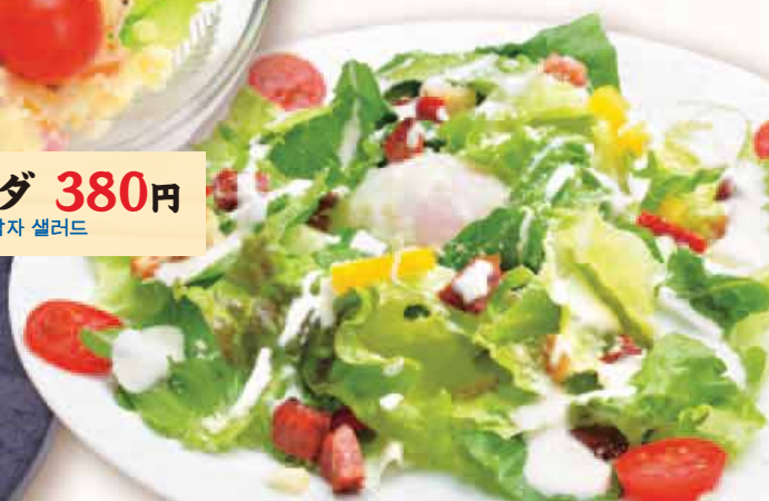
ロメインシーザーサラダ 550円 Caesar salad with soft-boiled egg 半熟鸡蛋的蔬菜沙拉 반숙 계란 시저 샐러드