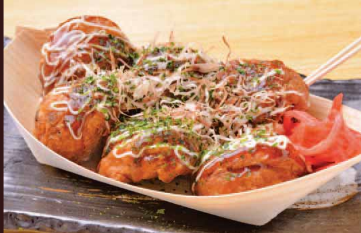
揚げたこ焼き Fried Octopus dumplings 炸章鱼烤 튀김 타코야끼