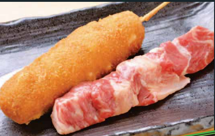
◆ 横綱牛ロース串かつ Beef loin 炸牛里脊串 소고기 등심 一本 480円