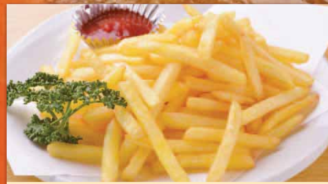
ポテトフライ 380円 French fry 炸薯条 감자 튀김