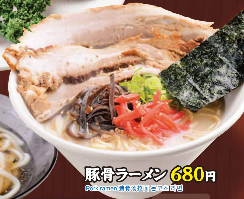
豚骨ラーメン Pork ramen 猪骨汤拉面 돈코츠 라면