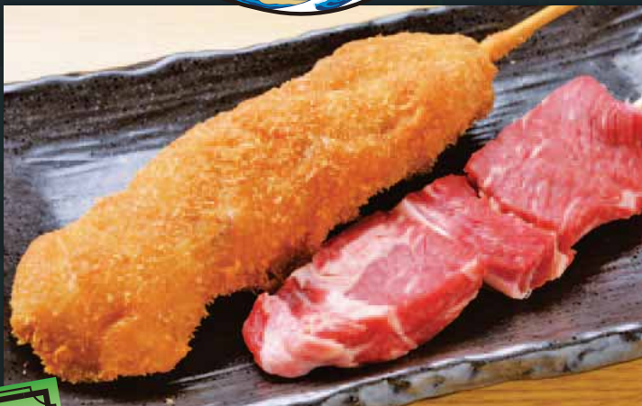
◆ 横綱牛串かつ Beef 炸牛肉串 쇠고기 一本 480円