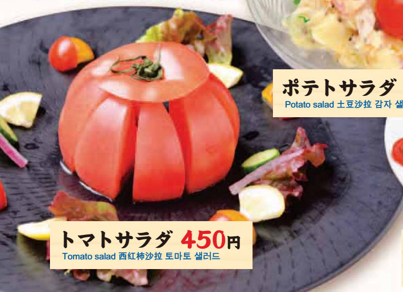
トマトサラダ 450円 Tomato salad 西红柿沙拉 토마토 샐러드