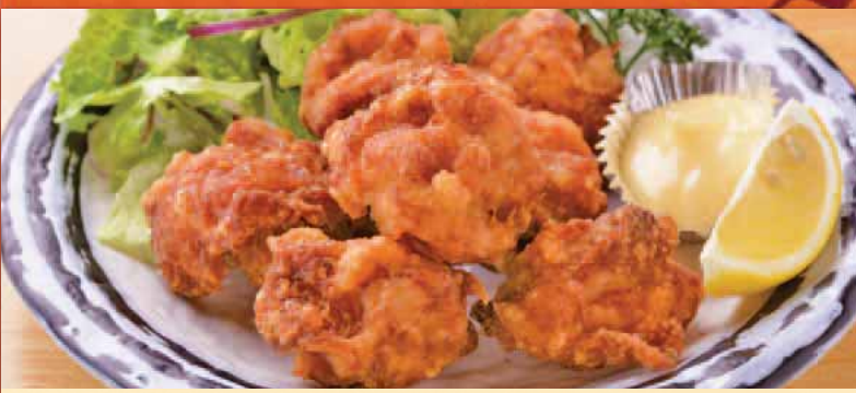
若鶏の唐揚げ 550円 Fried chicken 炸鸡肉块 프라이드 치킨