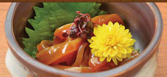
自家製いか醤油漬

Squid soaked in soy sauce 自制的酱油味凉拌生鱿鱼肉 간장에 담가 오징어