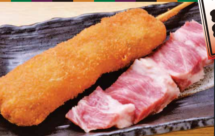
◆ イベリコ豚バラ串かつ Iberico pork ribs 炸西班牙猪肉串 이베리코 돼지 고기 一本 480円