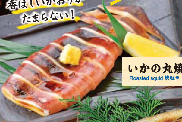
いかの丸焼き 550円 Roasted squid 烤鱿鱼 구운 오징어