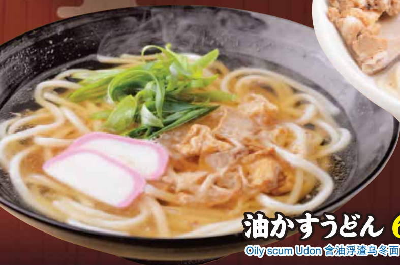
油かすうどん Oily scum Udon 含油浮渣乌冬面 기름 찌꺼기우동