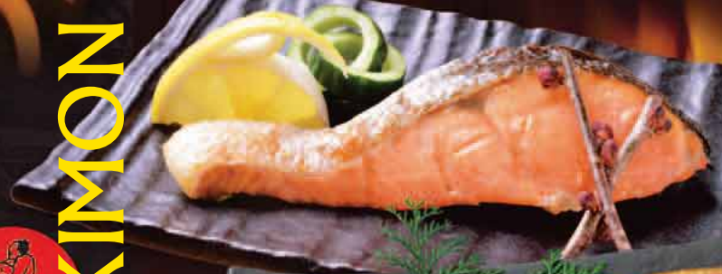
塩鮭 480円 Salted salmon 咸鲑鱼 자반 연어