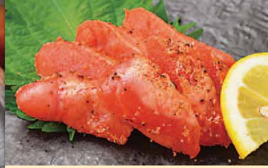
炙り明太子 450円 Roasted cod roe 烤鳕鱼子 구운 명란젓