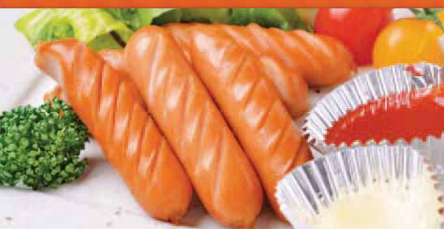
ウィンナーソーセージ 480円 Sausage 炸香肠 소세지