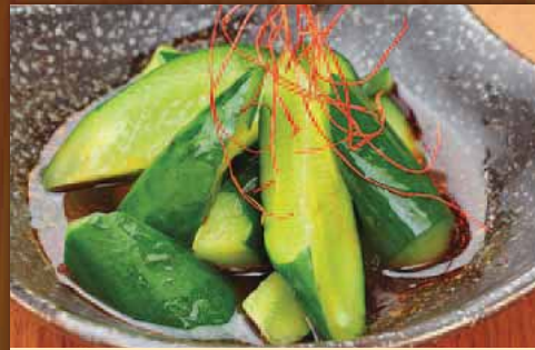
やみつき胡瓜 Seasoned cucumber 凉拌黄瓜 맛 내기 오이