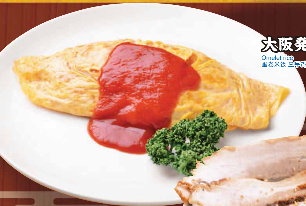
大阪発祥オムライス Omelet rice 蛋卷米饭 오무라이스