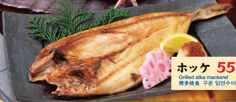
ホッケ 550円 Grilled atka mackerel 烤多线鱼 구운 임연수어