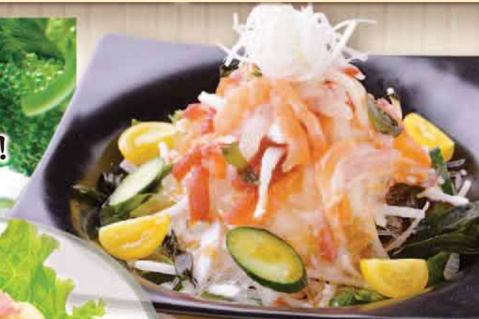
海鮮サラダ 650円 Seafood salad 海鲜沙拉 해물샐러드